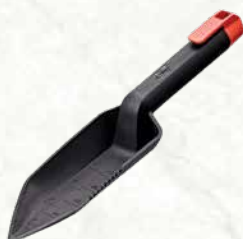
ИНСТРУМЕНТ ДЛЯ КОПАНИЯ