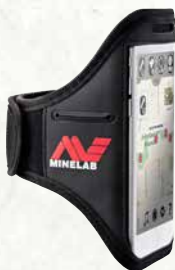
ДЕРЖАТЕЛЬ ДЛЯ СМАРТФОНА